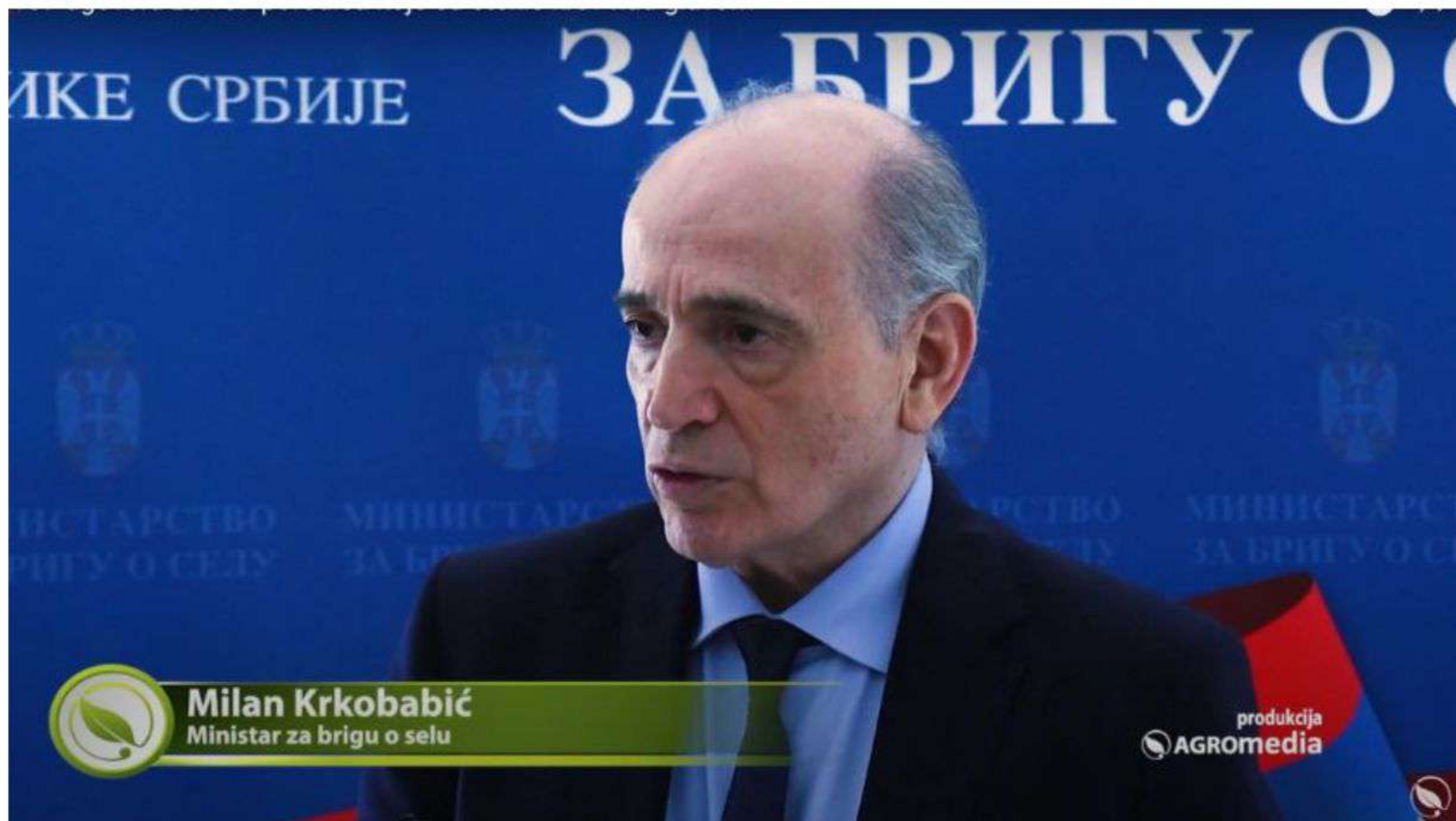
Milan Krkobabić Ministar za brigu o selu